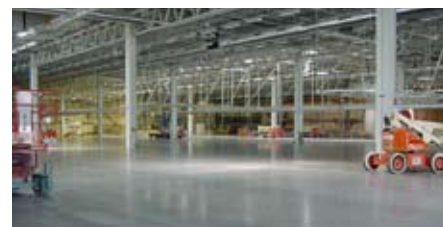
lindec flooring system