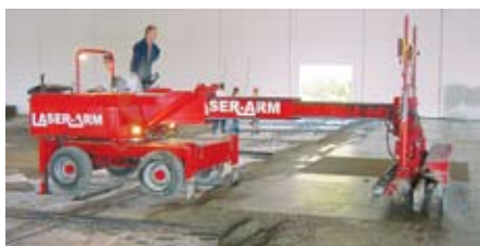
Многофункциональная машина Laser-Arm