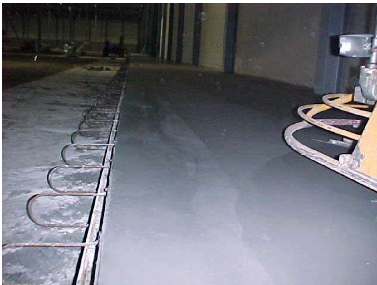
Säve Cargo; Skanska, Gothenburg, Sweden