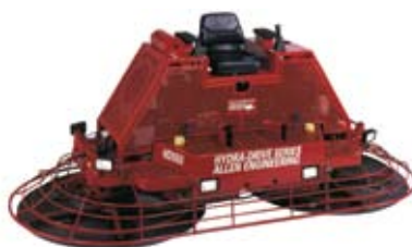
Оборудование для создания бетонных полов