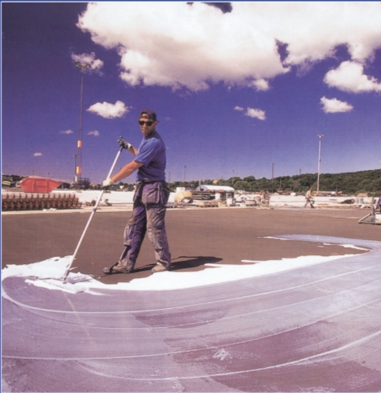
STORA Baseport, Göteborg, 58 000 m 2